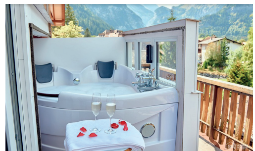
Auf den Zimmer- Balkon fahrenden Whirpool

ZUSATZGEDECK / COUVERT SUPPLÉMENTAIRE / ADDITIONAL COVER = +4CHF